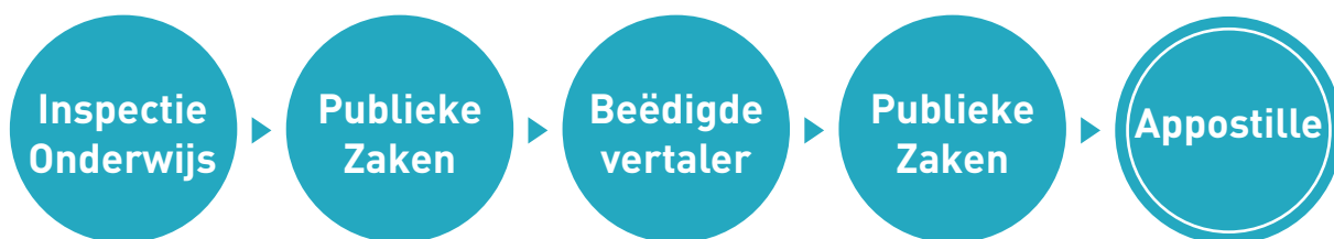
figuur 1. de stappen naar apostille

Indien het gaat om een legalisatie, dan moet het door de Inspectie gewaarmerkt document worden meegenomen naar Publieke Zaken en daarna naar het Directie Buitenlandse betrekkingen - DBB -, voor het authentiek maken van de handtekening van de medewerker van Publieke Zaken. Na de legalisatie neem je de gewaarmerkte kopie van je diploma mee naar een beëdigde vertaler. De vertaling, gehecht aan