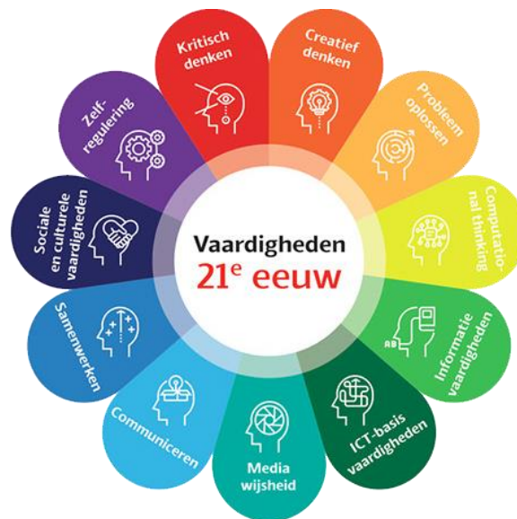
Figuur 3 Vaardigheden 21 e eeuw

Niet minder belangrijk is het ervoor zorgen dat de 21 e eeuwse vaardigheden een integraal deel vormen bij het bieden van het onderwijs in het algemeen en het afstandsonderwijs in het bijzonder. Een kwalitatief goed onderwijs en educatiesysteem hebben aandacht voor 21 e eeuwse vaardigheden en houden rekening met de verschillen in capaciteit en behoeftes van elk kind/jongere. Alleen dan kan ervoor gezorgd worden dat jonge mensen hun potenties beter ontwikkelen en gebruiken, dat ze minder vaak voortijdig, zonder diploma, het onderwijs verlaten en professioneel en ethisch gedrag ontwikkelen.